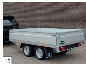
Option: ridelles en aluminium 40 cm de hauteur.