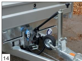
Option : pompe manuelle de secours (la télécommande amovible avec câble en spirale est de série avec toutes les pompes électriques).