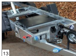
Option : pompe électrique avec batterie située dans une caisse en acier galvanisée, recouverte d'un couvercle plastique.