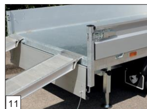
Option : les modèles en 280 et 305 cm de longueur ont un profil en U à l'arrière-côté.