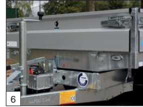
En série : avec 4 solides poteaux d'angle et une ridelle avant articulée.