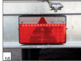
Option : Éclairage LED.