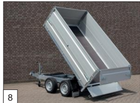
Option : réhausse en aluminium de 40 cm de hauteur, amovibles.