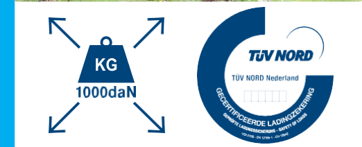
Toutes les remorques Hapert sont équipées du système d'arrimage de charge certifié TÜV !