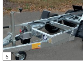
En série : pompe manuelle avec roue jockey escamotable