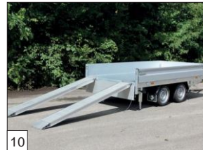
Option : pack- "DE CHARGE" monté: 2 rampes en aluminium de 2 500 mm de longueur intégrées avec 2 béquilles réglables (pas possible chez 2 1 500mm)