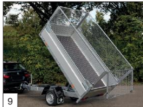
Option : réhausse grillagée amovibles de 75 cm de hauteur.