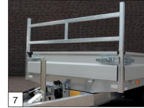
Option : porte-échelle amovible.