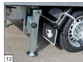
Option: béquilles réglables avec manivelle.