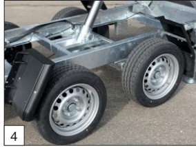
En série: châssis surbaissé avec pneus 195/50 R13.