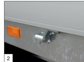
En série : ingénieuses charnières HAPERT pour une fixation extrêmement facile, par exemple du filet de chargement.