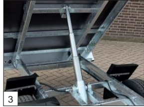
En série : un solide vérin hydraulique intégré (3-étages), angle de basculement d'au moins 60° !